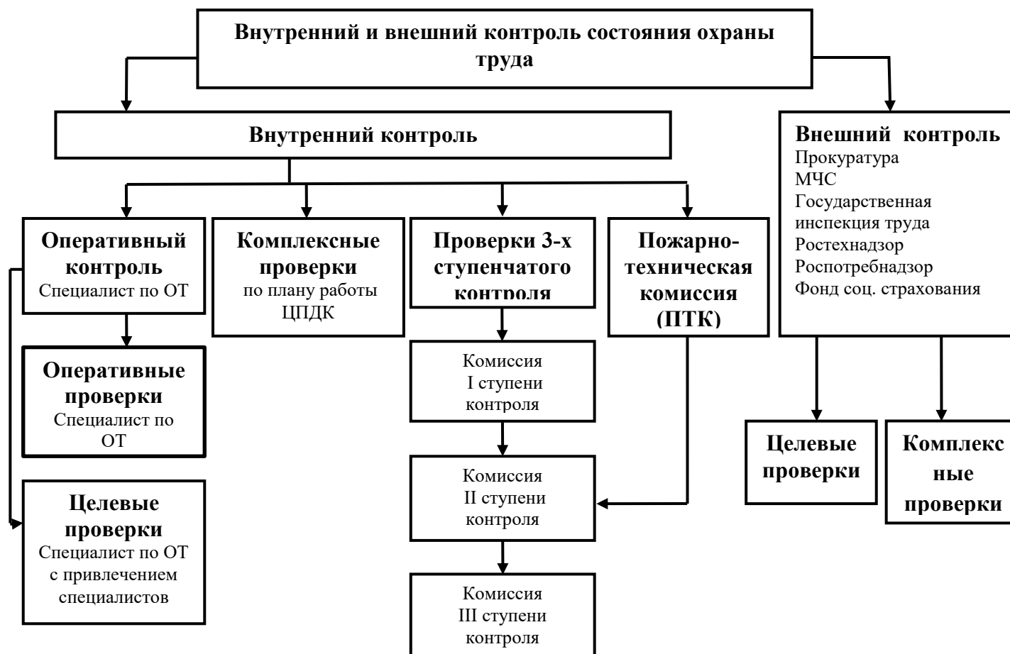
Схема организации внутреннего и внешнего аудита состояния охраны труда

Эффективность СУОТ оценивают с помощью внешних и внутренних проверок.